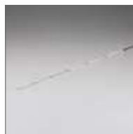
Solid carbon tip : scion en carbone plein