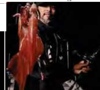
C68MH / FSL

Un peu plus puissant, ce modèle spinning permet de manier des egi squids de 15 à 45 g. Il peut aussi soutenir les plombées de vos montages tatakï jusqu'à 180 g. Cette canne est donc parfaite pour les pêches profondes, avec une forte dérive ou en présence de courants puissants.