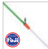
Color rod tip : scion coloris fluo